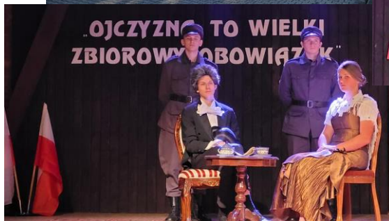
Zebrała dla Was: Maja Jezierska